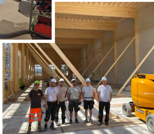
Das Aufbau-Team der Zehnder Holz und Bau AG

Montage Hochregallager: August – September 2023