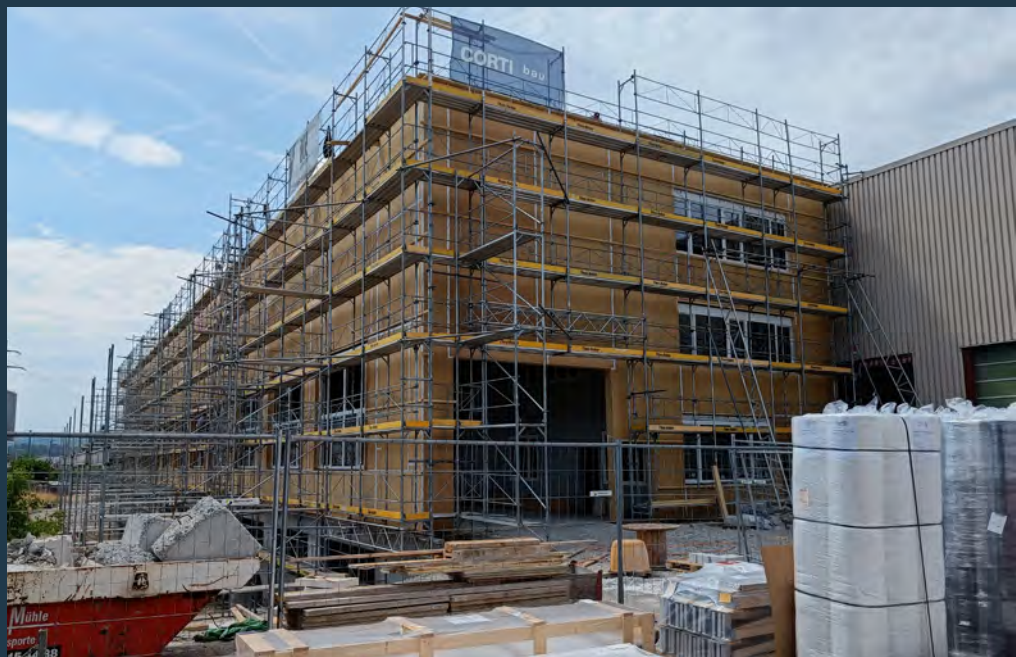
Aktueller Stand des Bauprojekts (Juli 2023)

Bei dieser Zusammenarbeit war die geographische Nähe zu Zehnder von grossem Vorteil. Die Zimmermänner des Winterthurer Traditionsunternehmens stehen dabei stellvertretend für viele weitere Unternehmen aus der Region. Die Entscheidung in diesem Bauprojekt,