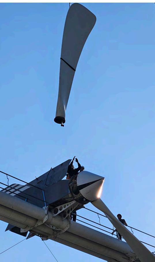
Demontage eines Rotorblatts