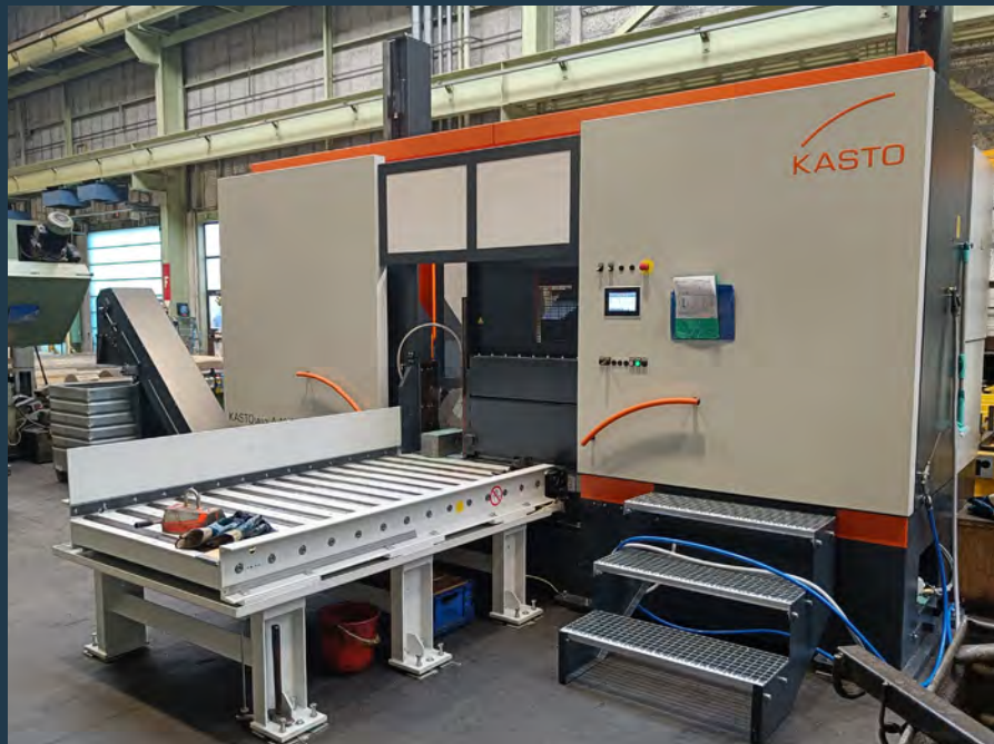
Die neue Sägemaschine des Stangenlagers

In unserem Stangenlager, in welchem wir Rohmaterialien lagern, zusägen und anschliessend unseren Kunden zustellen, haben wir deshalb in eine moderne Sägemaschine investiert. Der Entscheid fiel dabei auf eine KASTO-win A 10.6. Die hochmoderne Sägemaschine mit automatischer Materialzuführung kann mit ihrem Schnittbereich von 1'060mm überdurchschnittlich grosse Stangen zusägen. Gepaart mit der automatischen Materialzufuhr und -abfuhr können wir Bestellungen in fast allen Dimensionen so effizient wie möglich abwickeln.