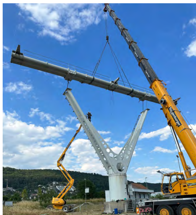
Abbau mit schweren Maschinen

Während der Abbauarbeiten im Juni war der Optimo Jobcorner mit drei Mitarbeitenden vor Ort. Auf einer Nabenhöhe von 15.6 Metern wurden die fast sieben Meter langen Rotorblätter demontiert und sorgfältig für den Transport bereitgestellt. Danach kam der Rest der Konstruktion an die Rei-